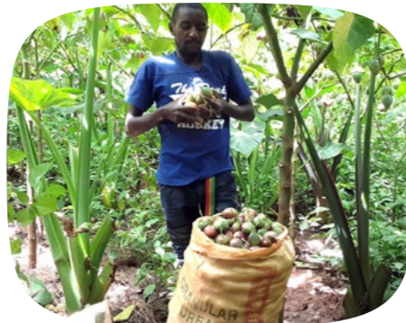
Ce participant du programme Șanđo au Burundi a lancé sa propre activité génératrice de revenus.

Chaque famille pourra aussi suivre des formations sur les droits de l'enfant et sur la parentalité positive. « Et, si nécessaire, nous pourrions fournir une aide financière dégressive pour couvrir des frais liés aux services sociaux de base : en prenant par exemple temporairement en charge les soins de santé d'une famille qui rencontre des difficultés, celle-ci pourra allouer son revenu à autre chose qu'à ses frais médicaux », complète Sophie.