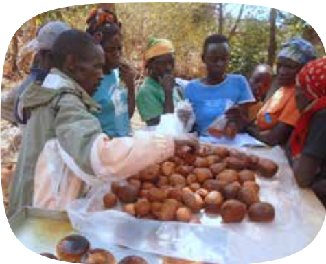
Plusieurs familles du programme Sanjo se forment en boulangerie.

Ce soutien dans l'accès aux services va régulièrement de pair avec un accompagnement vers l'autonomisation économique. Créer des opportunités économiques donne aux familles la possibilité d'améliorer durablement les conditions de vie de leurs enfants. Dans de nombreux pays, nous proposons aux adultes des formations professionnelles ou un appui matériel pour le lancement d'une activité génératrice de revenus.