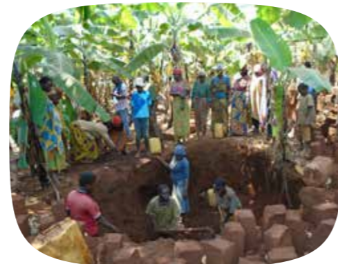
Au Burundi, la communauté s'entraide afin de construire des logements décents.