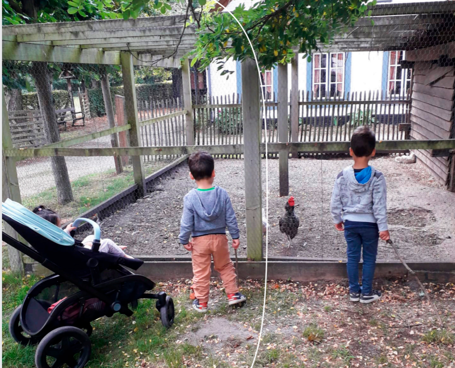
Plusieurs enfants du projet Simba ont profité de vacances bien méritées dans un parc de vacances.

Merci à Ackermans & van Haaren, Allianz, BASF, Bricks and Leisure, ENGIE Electrabel, Goodman, Patroba, le Fonds Louis Bourdon, le Fonds pour des soins solidaires de la Fondation Roi Baudouin et à tous ceux qui nous ont manifesté leur soutien.